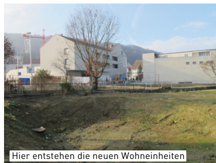
Hier entstehen die neuen Wohneinheiten