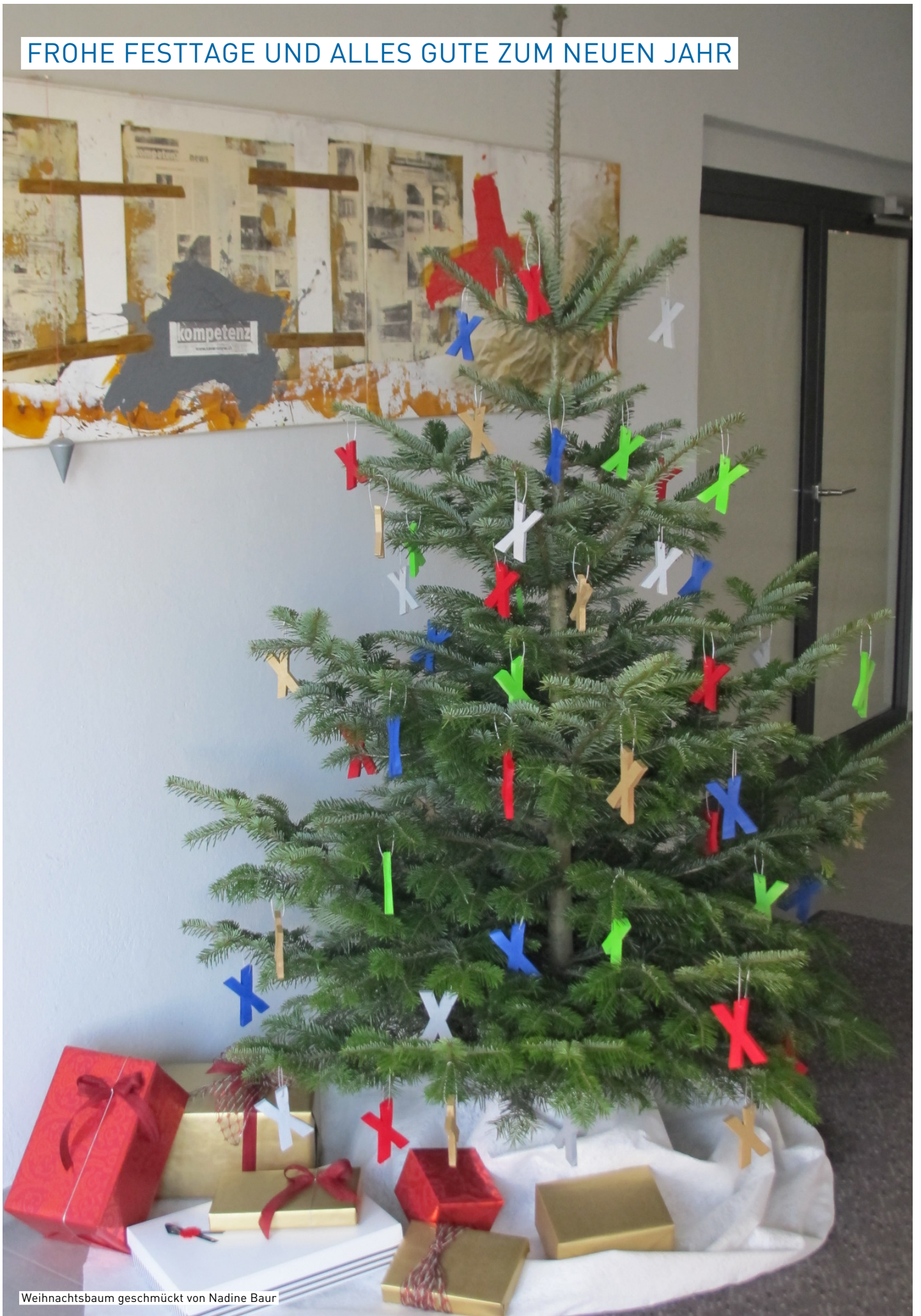
Weihnachtsbaum geschmückt von Nadine Baur

FROHE FESTTAGE UND ALLES GUTE ZUM NEUEN JAHR