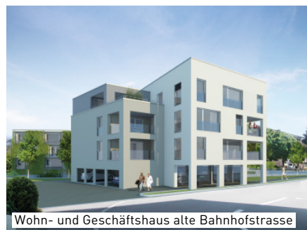
Wohn- und Geschäftshaus alte Bahnhofstrasse

Das Projekt „Erusbach“ liegt an ruhiger Lage im Zentrum von Villmergen. Die geplante Überbauung besteht aus zwei Mehrfamilienhäusern an der Mühlenstrasse und an der alten Bahnhofstrasse, welche durch eine Brücke über den Erusbach verbunden werden. Die Bachrenaturierung ermöglicht es, die Gesamtüberbauung über die beiden Parzellen zu realisieren. Beim Haus entlang des Baches basiert das Bauvorhaben auf zwei schlichten würfelförmigen Baukörpern, die mit offenen loggienartigen Zwischenräumen verbunden werden. Zur Dorfseite ergibt sich das Bild einer langgestreckten begrünten Wand. Das zentrale Wohn- und Ge-