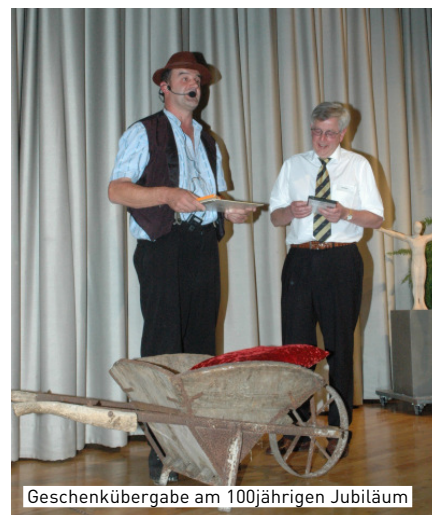
Geschenkübergabe am 100jährigen Jubiläum