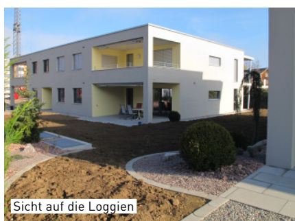
Sicht auf die Loggien

nen wie auch zusammenhängende naturnahe Flächen angeboten. Entlang des Baches müssen 15 Meter Bauabstand eingehalten werden, was für alle Wohnungen einen ausgedehnten Grünraum garantiert. Diese Anordnung bietet den Bewohnern, insbesondere auch für die Kinder, sehr spannende und hochwertige Aussenräume. Der Zugang von der Himmelrychstrasse zu den Treppenhäusern wurde mit Rampen stufenfrei gestaltet. Die Nutzung für gehbehinderte Personen ist in allen drei Gebäuden gewährleistet. Dem Besucher wird ein durchgehender Parkierstreifen entlang der Himmelrychstrasse angeboten.