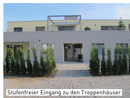
Stufenfreier Eingang zu den Treppenhäuser