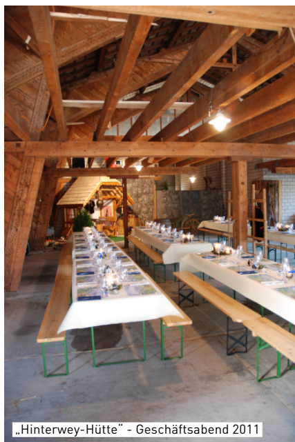
„Hinterwey-Hütte“ - Geschäftsabend 2011