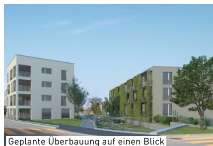
Geplante Überbauung auf einen Blick

folgt über die Mühlenstrasse. Die Gebäude werden nach MINERGIE® - Standard ausgeführt und zertifiziert. Für die Beheizung ist eine Wärmepumpe vorgesehen. Der Baubeginn erfolgt anfangs 2012, das Bauende ist im Frühling 2013 (Wohnhaus A) und im Sommer 2013 (Wohn- und Geschäftshaus B) vorgesehen.